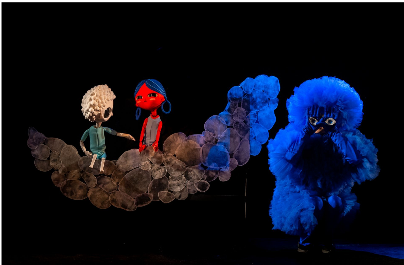
Arlekin i Pinokio razem w trosce o prawa dzieci. Spektakl „Dzieci i Ryby”